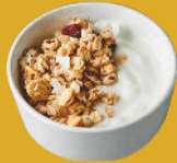
Lactis: Llet, iogurt, formatges...