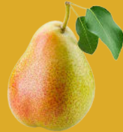
Fruites: La millor opció és una peça de fruita sencera de temporada.