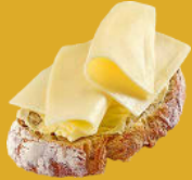
Farinacis: pa, cereals...